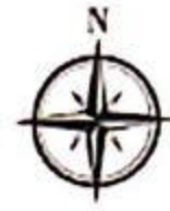
附图：检测点位示意图